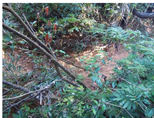
Fotos 2: Trecho do leito do Riacho do Morro – sem fluxo de água (11.06.2013)

Membros do SCBH Rio Bicudo apontaram como um dos principais problemas da bacia a escassez de água em grande parte das comunidades rurais. Durante o levantamento de campo, verificou-se que afluentes do Rio Bicudo possuíam trechos sem água, como se observa na fotografia ao lado.