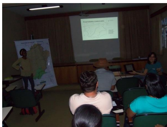
Fotos 1: Apresentação do estágio do projeto na reunião do SCBH Rio Bicudo em 24.07.2013

Dentro das ações previstas no âmbito do levantamento ambiental, ocorreu a apresentação do estágio do Projeto na reunião do SCBH Rio Bicudo, no dia 24 de julho de 2013. A reunião contou com a participação dos representantes do Subcomitê de Bacia Hidrográfica do Rio Bicudo - SCBH Rio Bicudo e da equipe de mobilização do Comitê de Bacia Hidrográfica do Rio das Velhas - CBH Rio das Velhas (Fotos 1).