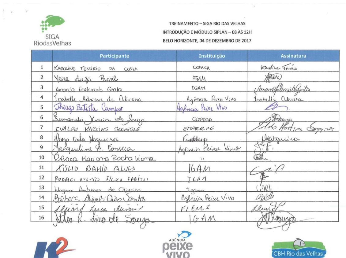
Figura 1 – Lista de presença 04/12 – Manhã – Página 1