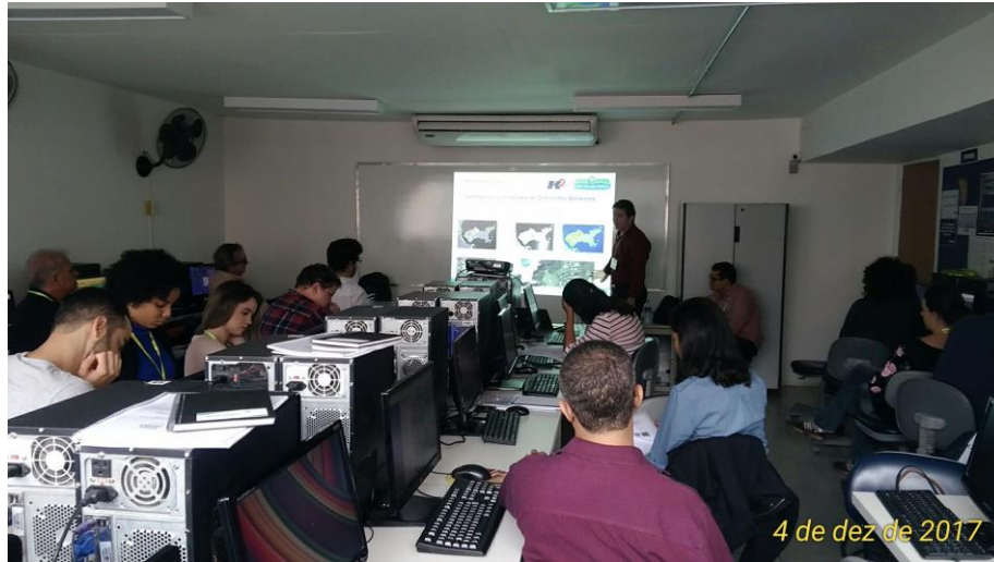
Figura 25 – Fotos do Treinamento 17