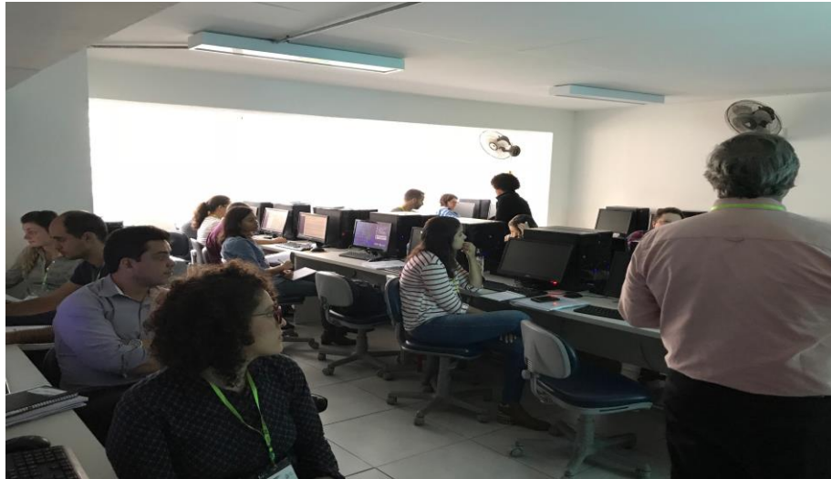
Figura 11 – Fotos do Treinamento 3