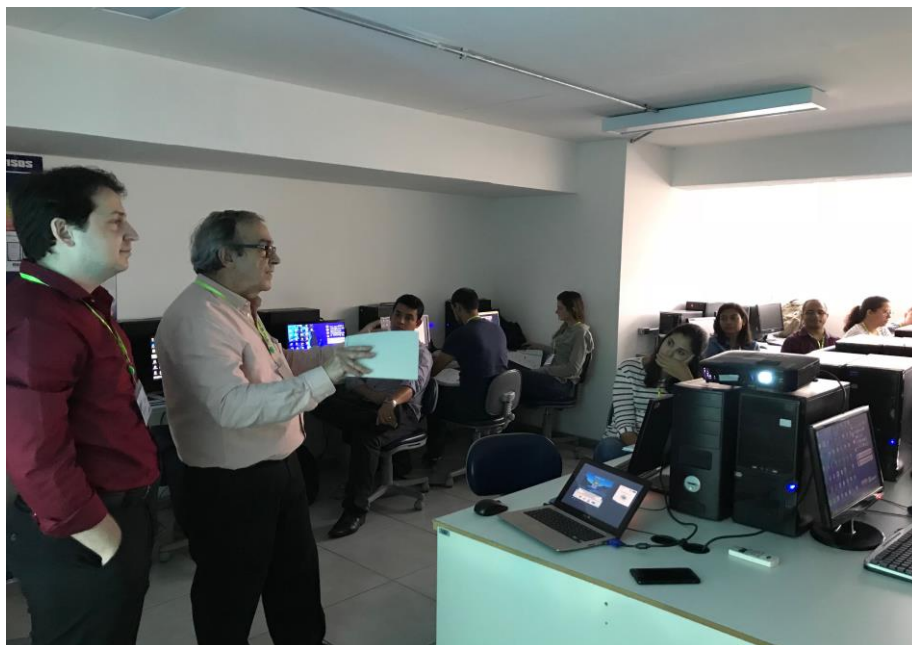
Figura 10 – Fotos do Treinamento 2