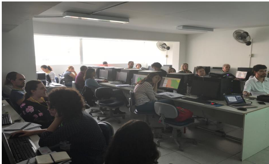
Figura 16 – Fotos do Treinamento 8