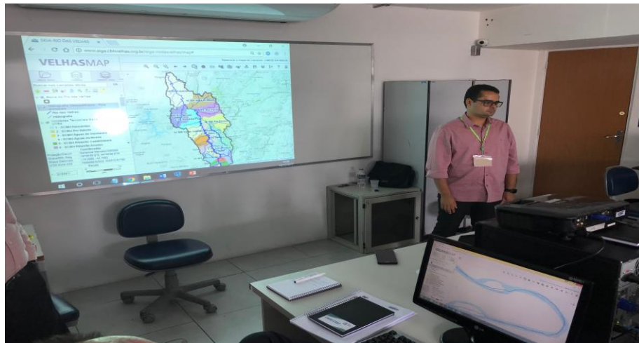
Figura 19 – Fotos do Treinamento 11