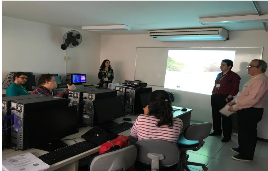
Figura 13 – Fotos do Treinamento 5