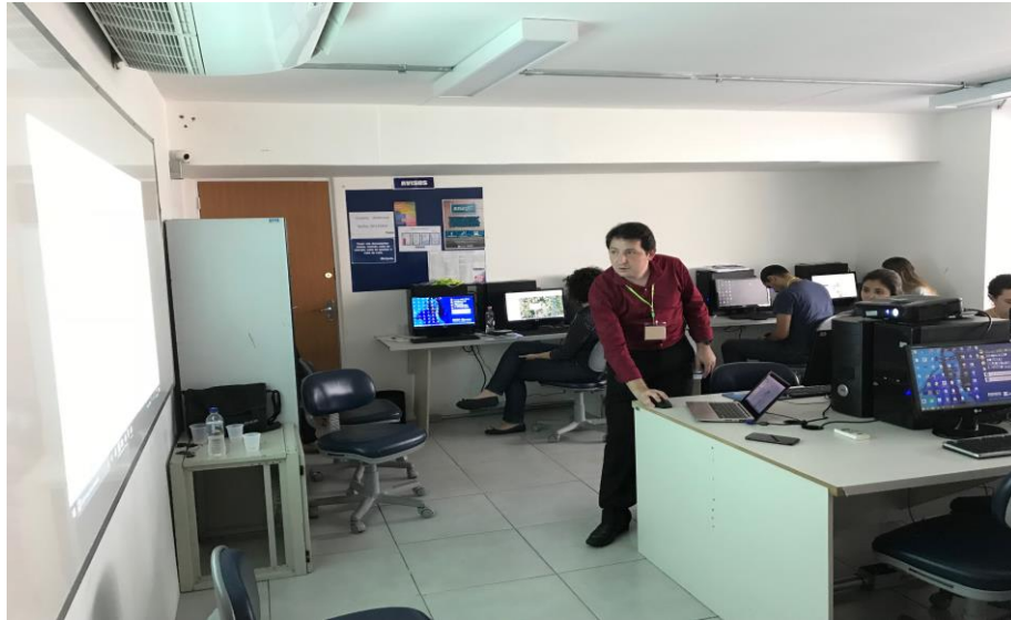
Figura 15 – Fotos do Treinamento 7