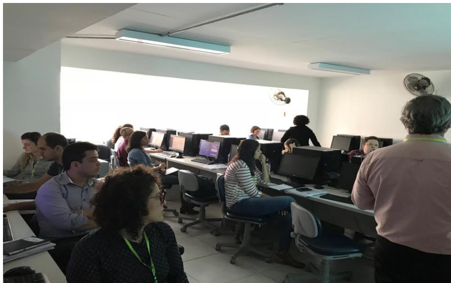
Figura 12 – Fotos do Treinamento 4