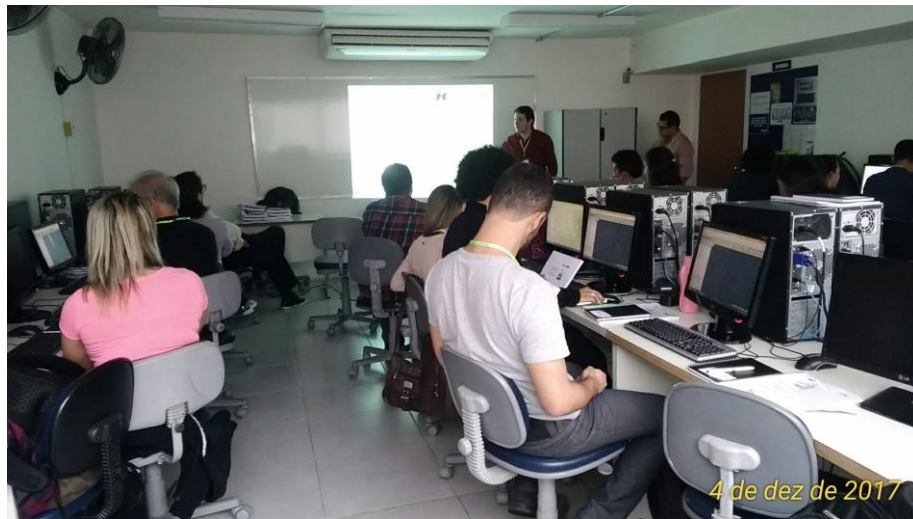
Figura 23 – Fotos do Treinamento 15