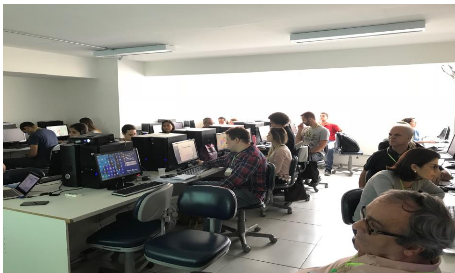
Figura 14 – Fotos do Treinamento 6