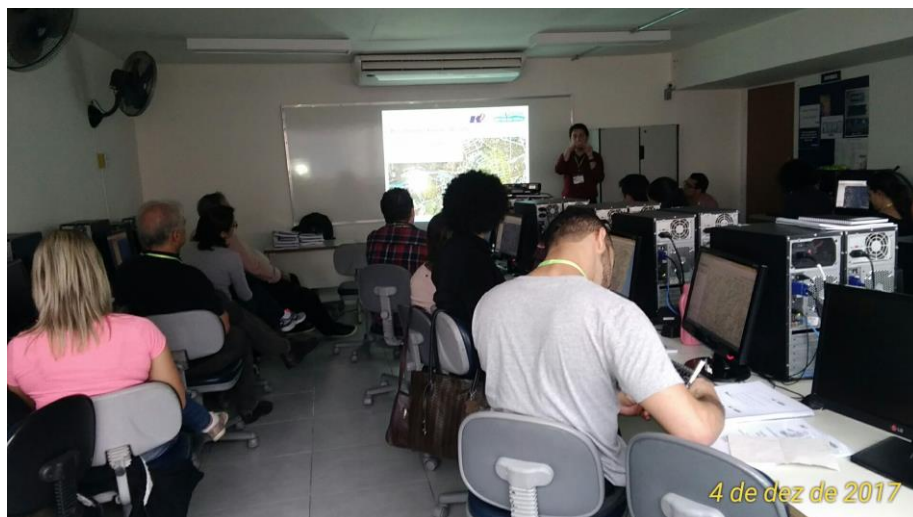
Figura 24 – Fotos do Treinamento 16