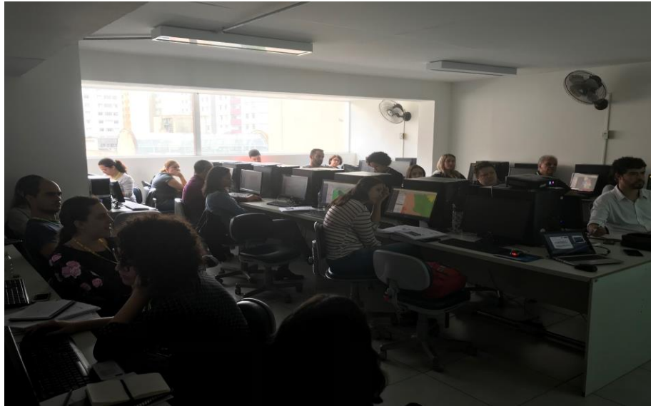
Figura 17 – Fotos do Treinamento 9