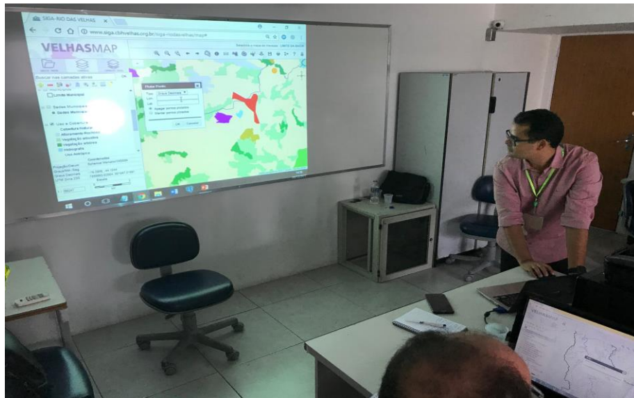
Figura 21 – Fotos do Treinamento 13