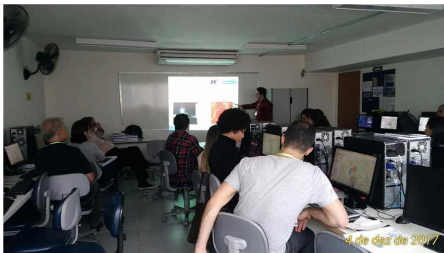
Figura 22 – Fotos do Treinamento 14