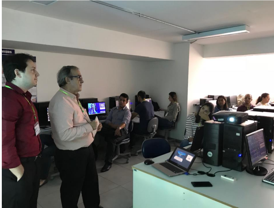
Figura 9 – Fotos do Treinamento 1