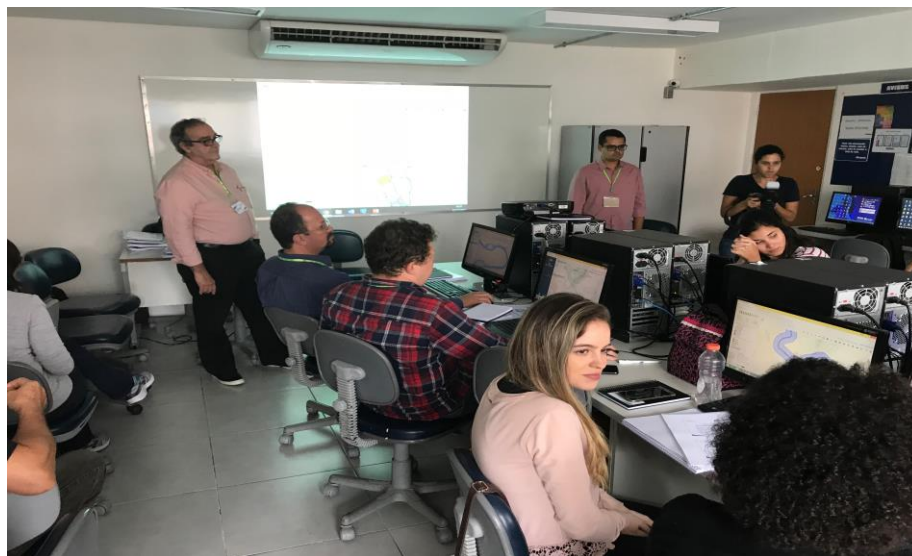
Figura 20 – Fotos do Treinamento 12