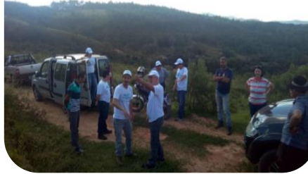
“Produtor de Águas do Ribeirão Carioca” – PSA - Itabirito