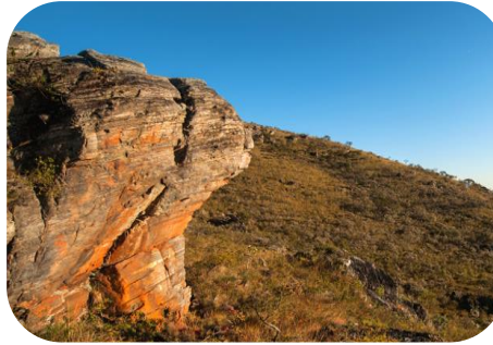
Estudos para criação da UC “Pedra Rachada” – Caeté-Sabará