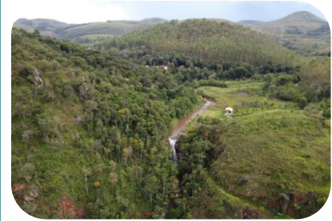
Diagnóstico e Plano de Ações para o Alto Maracujá- Nascentes