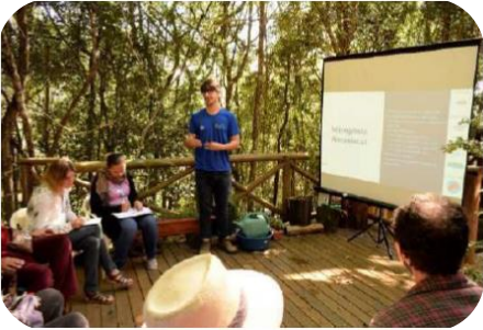
“Por aqui passa um rio” – Águas da Moeda