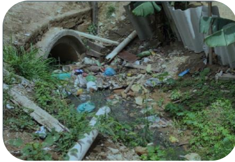
“Revitalização de Área Verde e Fundo de Vale” - Onça