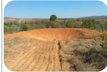
Projeto Hidroambiental - Bicudo