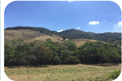
Mapeamento e criação de áreas de conectividade - Taquaraçu