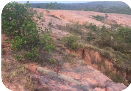
Proteção e Conservação do Córrego do Machado – Jequitibá