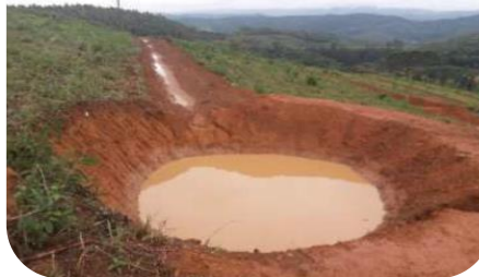
Projeto Hidroambiental - Cipó